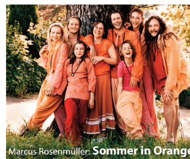
Marcus Rosenmüller: Sommer in Orange