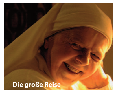
Die große Reise