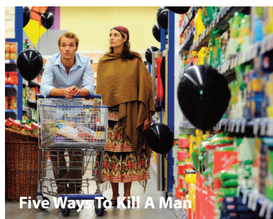
Five Way - To Kill A Man