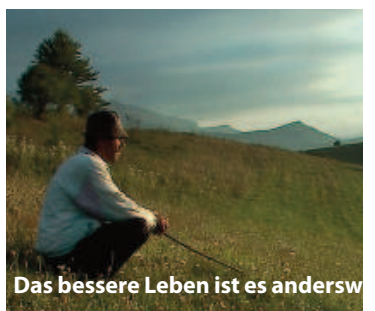
Das bessere Leben ist es anderswo

Bigger Than Life! In Langzeitproduktionen versuchen die Filmemacher im diesjährigen Dokumentarfilmwettbewerb, das Leben in den einzelnen Situationen nachzuempfinden. Begleitet werden dabei drei ganz unterschiedliche Protagonisten in drei verschiedenen Ländern in Das bessere Leben ist anderswo (CH), ein indischer Guru auf der Sinnsuche in Sadhu (CH) oder Gefangene in der Haftanstalt von Thorberg (CH). Vier alte Nonnen in einem österr. Kloster erwarten Die große Reise (AT). In Still (D) wird eine Jungbäuerin am Tegernsee, in Vaters Garten (D) die Eltern beim Älterwerden, in Nägel mit Köpfen (AT) die 30-jährigen bei ihrer Festlegungs-, Partnersuche und in Outing (AT) ein pädophiler junger Mann auf seiner Lustsuche beobachtet. Die Zeit vergeht wie ein brüllender Löwe (D) findet ganz eigene Bilder zum Thema Zeit.