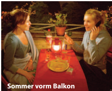
Sommer vorm Balkon

Der erste Moment eines Films ist die Idee. Dann wird sie zur Papier gebracht, ausformuliert, abgewogen, verworfen, neu gestaltet, verändert, angeglichen und schließlich irgendwann verfilmt. Meist bleibt dieser Schaffensprozess nicht weiter beachtet. Im scheinwerferlicht stehen andere. Das Fünf Seen Filmfestival will - nun schon zum zweiten Mal - das Drehbuch in den Vordergrund stellen. Zum einen mit einer kleinen Reihe von Filmen mit prämierten Drehbüchern - von heute beim OSCAR oder in Deutschland bis zurück zu einigen Meisterwerken der Filmgeschichte. Zum anderen natürlich mit unserem Ehrengast.