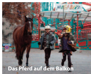
Das Pferd auf dem Balkon