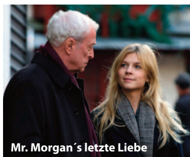
Mr. Morgan's letzte Liebe