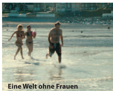
Eine Welt ohne Frauen

Mit Philippe Lioret kommt ein renommierter, äußerst engagierter französischer Regisseur aus der Bretagne nach Starnberg, der in Deutschland mit Die Frau des Leuchtturmwärters mit Sandrine Bonnaire (Fr., 2.8., 21.30 Uhr OPEN AIR und in der Schloßberghalle) und Keine Sorge, mir geht es gut bekannt wurde. Im vergangenen Jahr war auf unseren Leinwänden das Flüchtlingsdrama Welcome zu sehen. Für seine Filme wurde er mit mehreren französischen, deutschen und auch dem Europäischen Filmpreis ausgezeichnet. Wir freuen uns, dass er persönlich am Freitag, 2.8., 19.00 Uhr in Starnberg seinen neuesten noch nicht in Deutschland erschienenen Film Toutes nos envies - All unsere Lüste präsentiert. Claire, eine junge Richterin in Lyon, kämpft darin einen verzweifelten Kampf für Menschen in der Schuldenfalle.